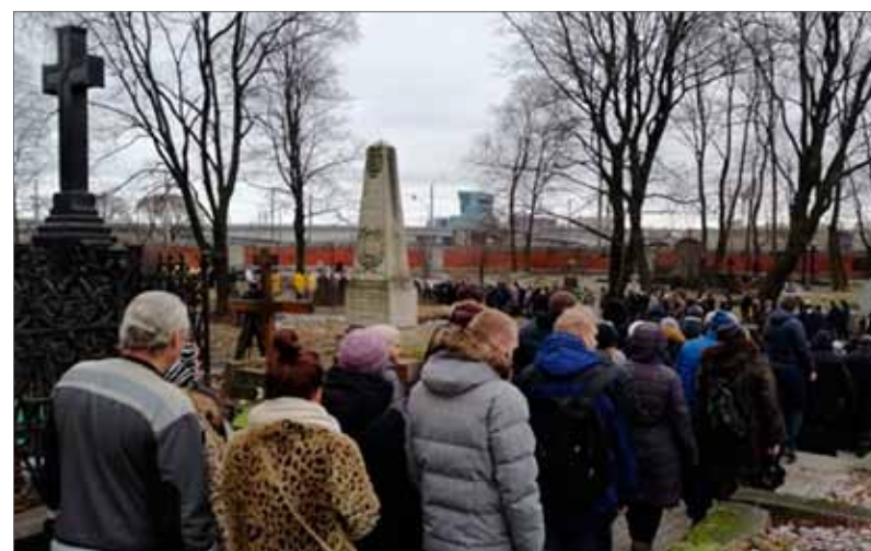
Участники крестного хода на Никольском кладбище